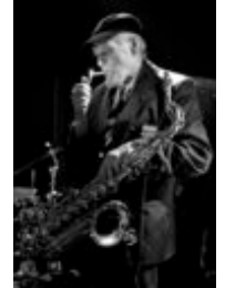
Filip Błażejowski Portrety