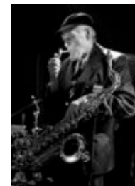
Filip Błażejowski Portrety